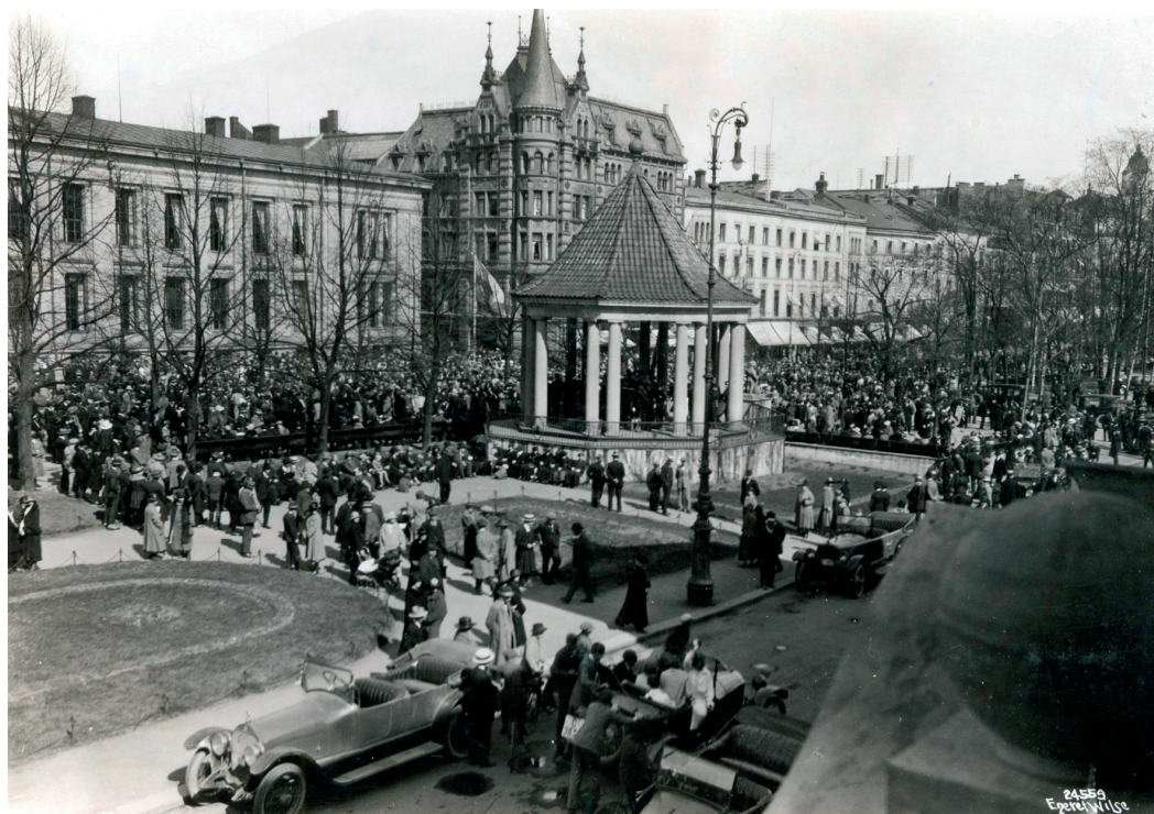
Musikkpaviljongen ved Karl Johans gate, Oslo 1924.