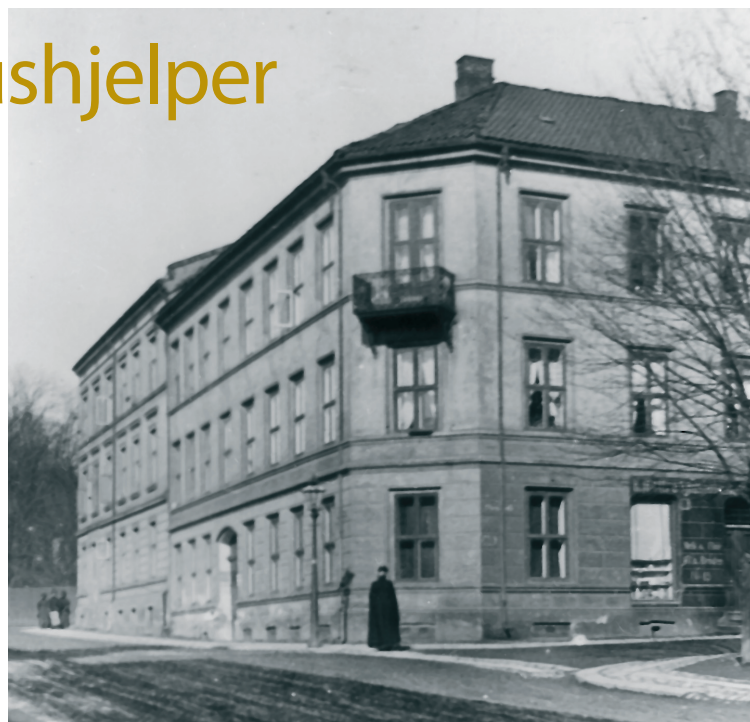
Wessels gate 15, 1897.

Byggemeldingstegning for 1. etasje i Wessels gate 15, 1865. (Pikeværelsene skravert i rødt.)