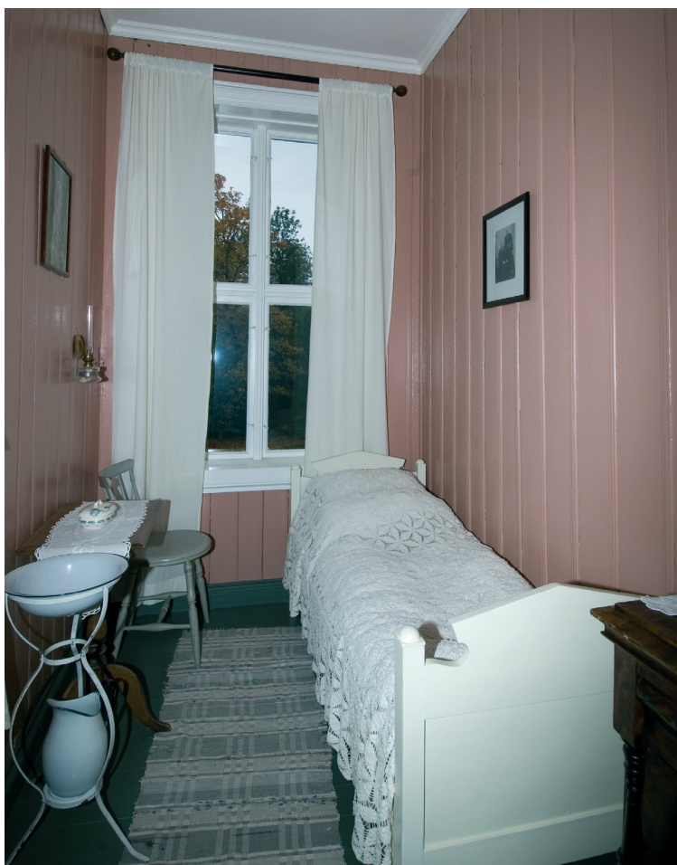
Pikeværelset i leiligheten fra 1905 i Wessels gate 15.

I sine arbeider fra midten av 1800-tallet observerte Eilert Sundt at unge menn i lavere sosiale klasser ikke nødvendigvis falt for kvinnelig ungdom, ynde og skjønnhet, men snarere så seg om etter et "kvindfolk" som både var en dyktig husmor, kokkekone og budeie, ja, hun måtte være med "at bygge hus og at samle til hus". Men som Eilert Sundt påpeker, vi må ikke av den grunn tro at gutten tok jenta bare fordi hun hadde samlet seg gryte og bakstefjel og sengeklær, nei, gutten satte pris på disse tingene fordi de vitnet om "pigens sparsommelighed og virkelyst og husholderiske anlæg – egenskaber, som han ifølge hele sin stilling nødvendigvis må agte såre høit". 3 Slik sett kan vi si at ekteskapsmarked og arbeidsmarked hang sammen og at tjenestetida var en form for investering som skulle sikre framtida. Tjenestetida var en læretid og en forberedelse til ekteskapet. I tjenesten fikk