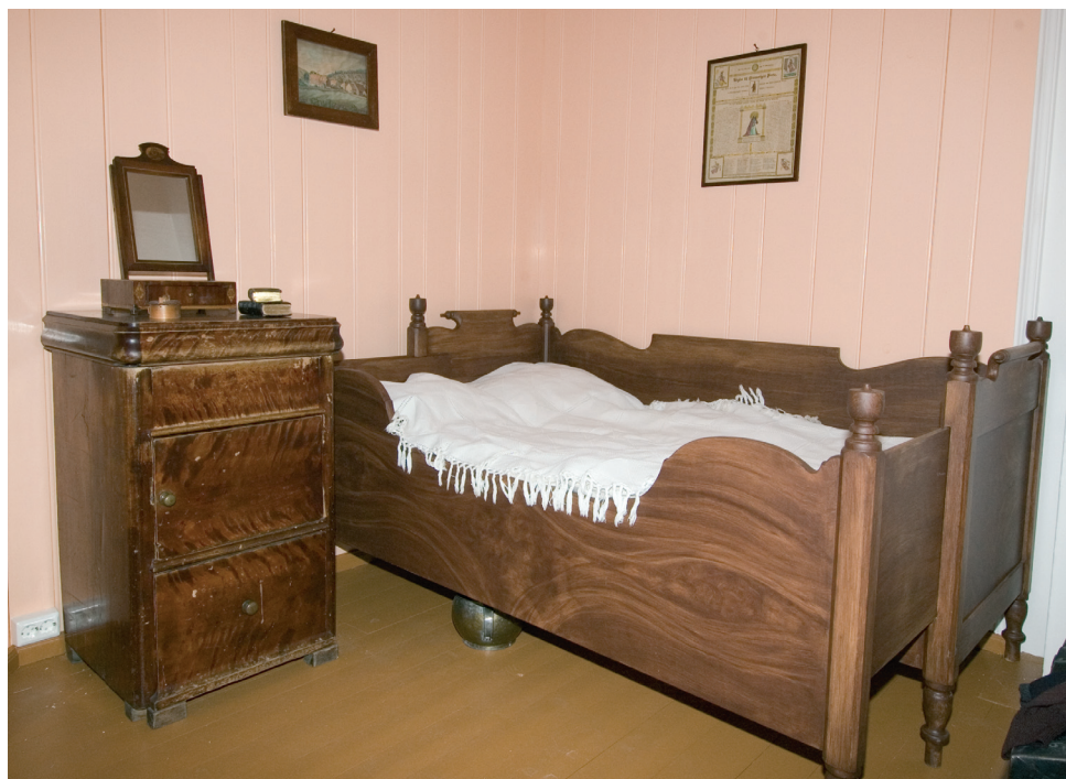
Fra pikeværelset i leiligheten " Et dukkehjem - 1879" i Wessels gate 15.

unge jenter kunnskaper og ferdigheter som var nødvendig for å kunne styre eget hushold.