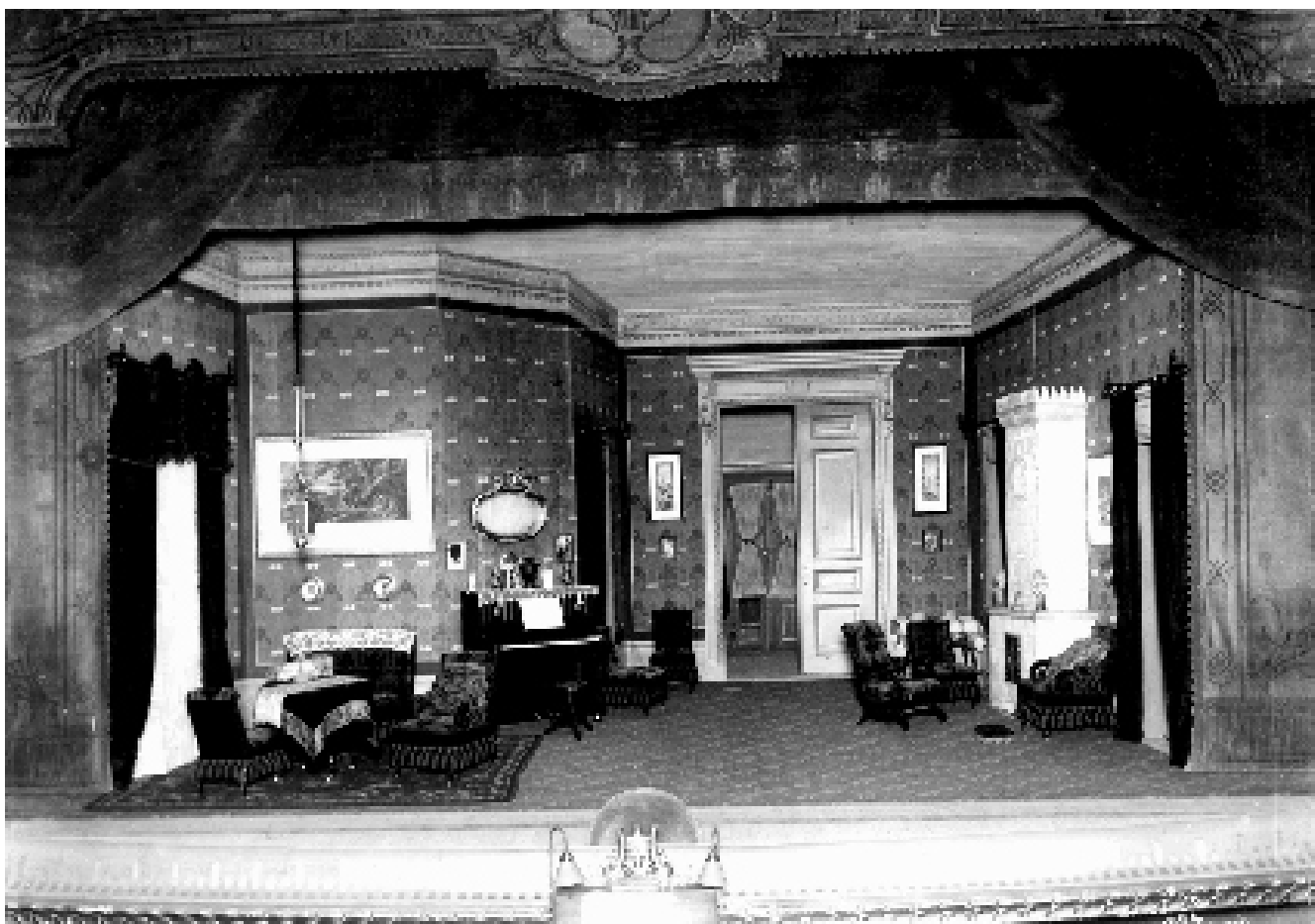
Scenebilde fra oppsetningen av "Et dukkehjem" på Nationaltheateret i 1906

moderne mennesket utvikles. Iscenesettelsen av familiens hjem ble derfor tillagt stor vekt. Nye innredningsidealer, så vel estetiske som teknologiske forbedringer, ble tillagt stor oppmerksomhet. Uttrykket My home is my castle skriver seg fra denne tiden. Inne i boligen fantes en hierarkisk gradering av rommene. I leiligheten i Wessels gate var det tre "offentlige" rom som lå ut mot gaten. Her mottok man visitter og dyrket selskaperlig samvær, og det lå mye prestisje i innredningen. Bakenfor gikk en gang som delte leiligheten i to, og her regjerte husmoren over sine barn og sine tjenestepiker.