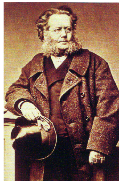
Henrik Ibsen i München, 1878

Å rekonstruere en leilighet som "Et dukkehjem - 1879" krever mye og svært forskjellig fagkunnskap: Kunnskap om bygningens historie, materialer og håndverksmessige utførelse; kunnskap om datidens teknologi, lys, varme og sanitære forhold; kunnskap om dekor, farger og gamle maleteknikker; kunnskap om listverk og profiler, om tidens tekstiler, ovner, møbler, bilder på veggene og hvordan dekke et bord. Med andre ord, kunnskap om alt det som utgjør en leilighet, et hjem i en annen tid. Til og med skilting til Torvald Helmers kontor må nøye diskuteres. Og hva med kleshengere, når kom de? Mange ulike fag og kompetanseområder møtes og samarbeider for å finne frem til hva som var "riktig" for et hjem som ble satt sammen for 125 år siden. Man kan se på dette arbeidet som kulturhistorie i praksis. OBOS-gården Wessels gate 15 har gitt Norsk Folkemuseum en unik mulighet til å vise hva et samlet kulturhistorisk museum kan utrette.