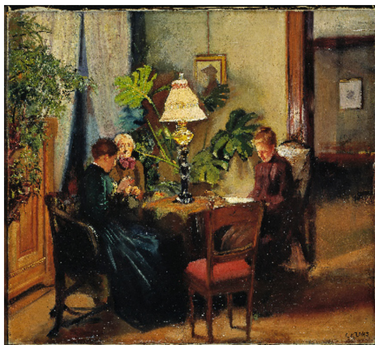
Christian Krohg: Chez nous.

Christian Krohg maler det kjente portrettet av Venstres leder Johan Sverdrup (1882). Edvard Grieg leder Musikselskabet Harmonien i Bergen og han komponerer noen av sine mest